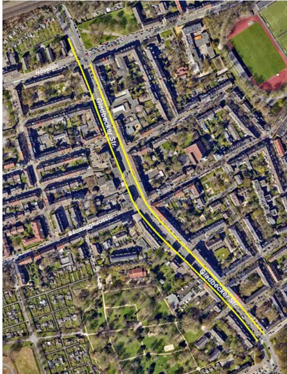
Gelb = Häuserfassaden Gladbecker Straße 220-313, an welchen der Lärmschutz gefördert wird.

Gefördert werden Maßnahmen entlang der gelb gekennzeichneten Fassadenflächen.